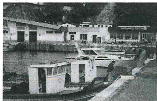
Arreglant les xarxes.

L'evolució de les persones ocupades en el sector també ha seguit una tendència alcista. L'any 1972 ocupava a 139 persones, que deu anys després passaren a 232, i a 287 enguany. Hi caldria afegir el personal al servei de la Confraria. La bona situació del sector va permetre que a partir de la crisi econòmica s'hi incorporés gent procedent de la indústria, sobretot de la construcció, i joves que cercaven la primera feina. Actualment, doncs, queda assegurat el recanvi generacional, tant pel que fa a patrons com a mariners.