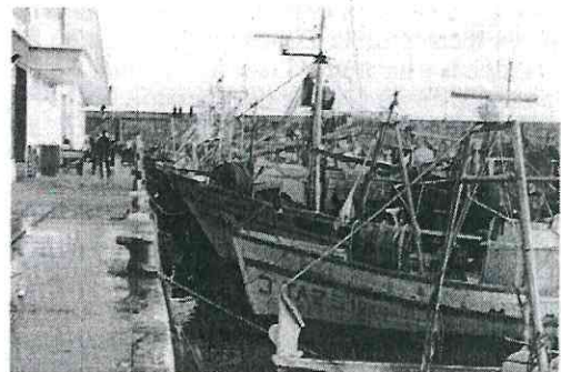
Barques amarrades després de la pesca.

Quant al nombre d'embarcacions, des de 1981 experimenta un fort augment fins que l'any 1985 es va limitar, es va establir un Tonatge de Registre Brut (TRB) de 1.443. Des d'aquest moment la concessió de noves llicències està condicionada al fet que es produeixi alguna baixa. Aquestes mesures estan relacionades amb la saturació del moll i la necessitat de vetllar pels caladors de pesca.